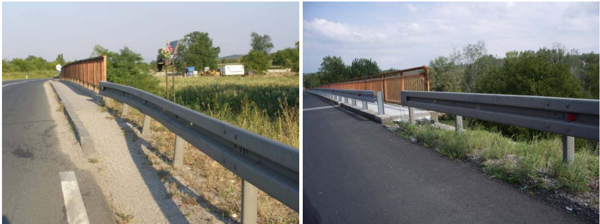
Slika 2. Primeri potencijalno opasnih mesta na prelazima zaštitne čelične ograde

Projekti saobraćajne opreme ne sadrže ni minimum dovoljno preciznih podataka o vrsti ograde koja se projektuje (osim eventualno izbora tipa ograde sa ili bez distancijala). Takođe se u tehničkoj dokumentaciji ne precizira ni međusobno rastojanje stubova, što znači da nije određen stepen jačine udara. Na mestima prelaska puta na mostovske konstrukcije, projektantski nisu rešene promene tipa ograde i načina vezivanja za podlogu, što u većini slučajeva predstavlja nerešive probleme za izvođača radova pri ugradnji zaštitnih ograda.